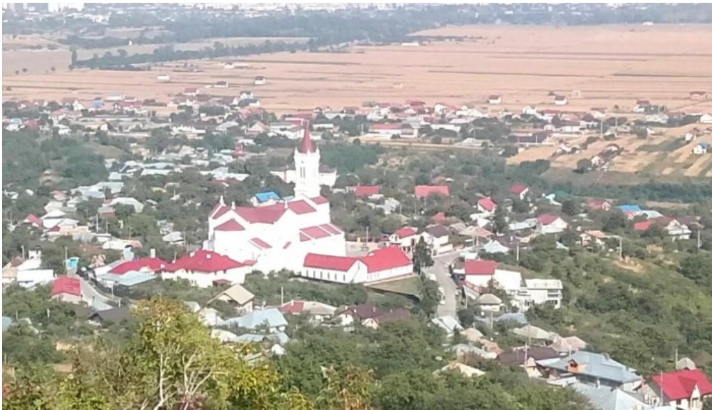
Parohia luizi calugara luizi c?lug?ra