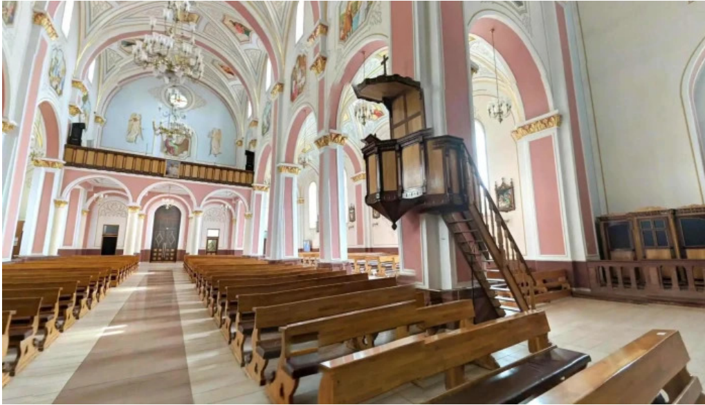
Parohia luizi calugara street view si 360deg