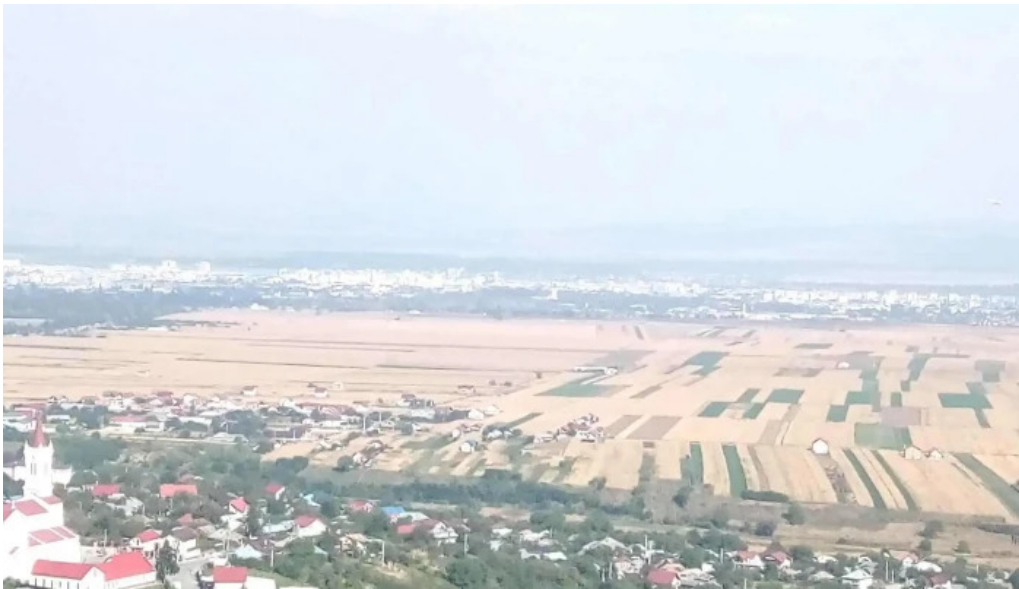
Parohia luizi calugara scor