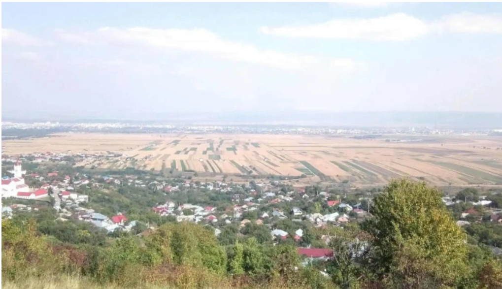
Parohia luizi calugara comentarii