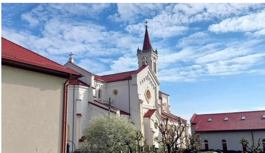
Parohia luizi calugara aproape de mine