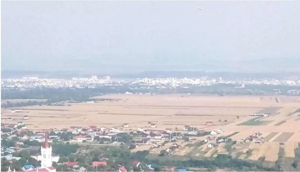
Parohia luizi calugara program