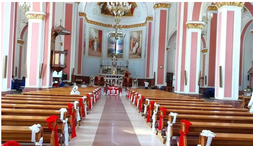
Parohia luizi calugara biserica