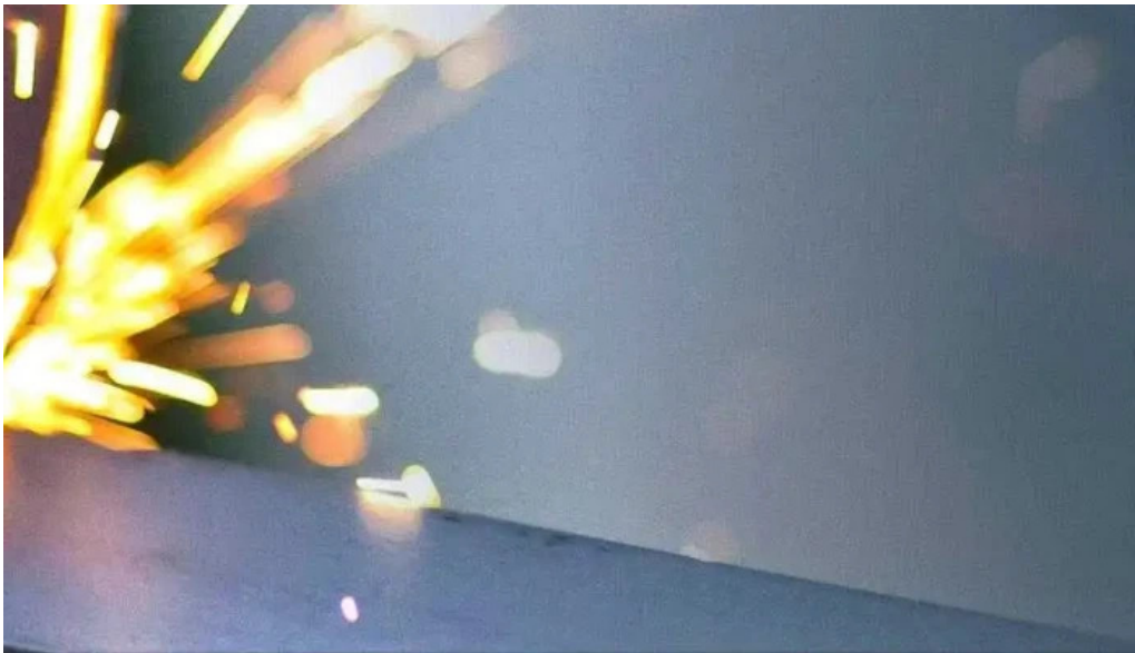
Ustinex srl drobeta turnu severin