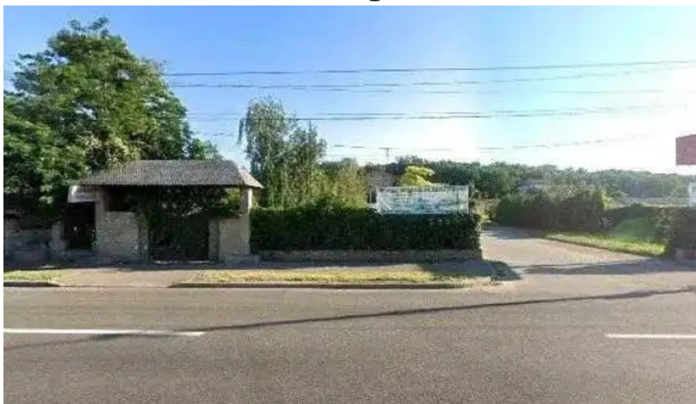
Ustinex srl street view si 360deg