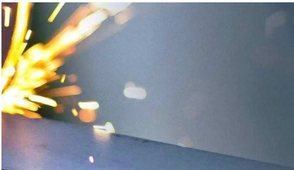
Ustinex srl deschis acum