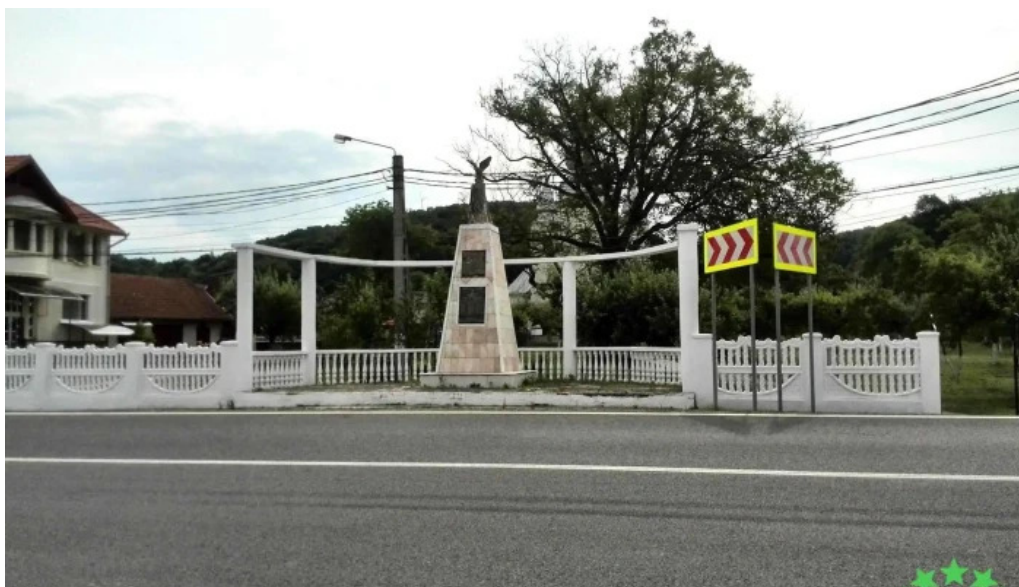
Buciumi deschis acum