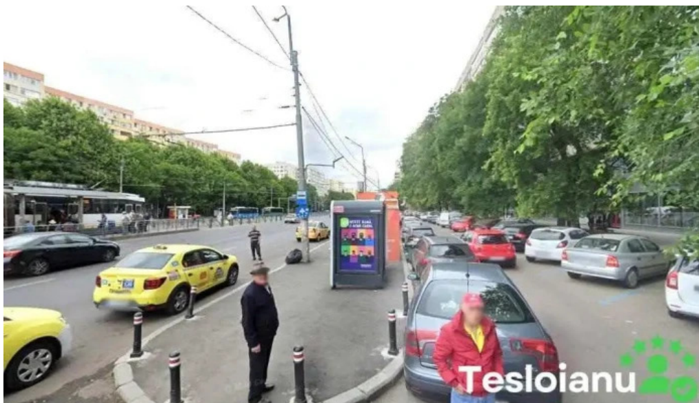
Deblocari usi auto bucure?ti