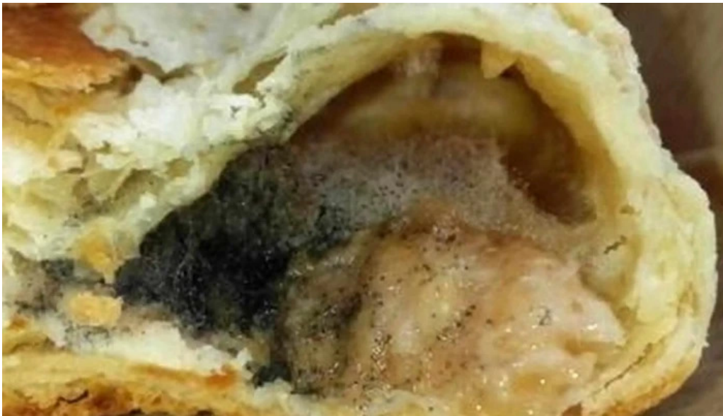
Agneza lacto bar c?l?ra?i