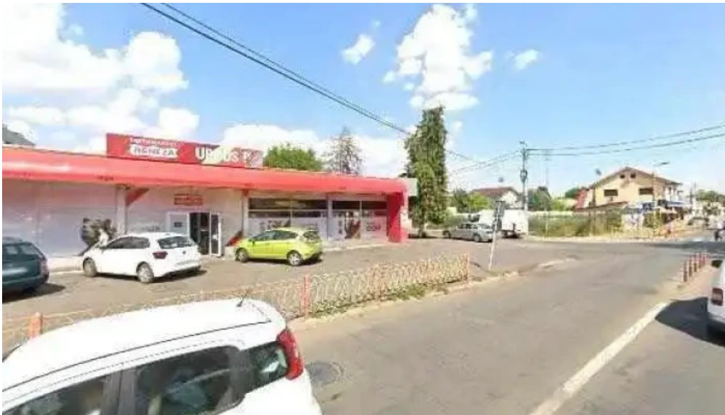
Agneza lacto bar street view si 360deg