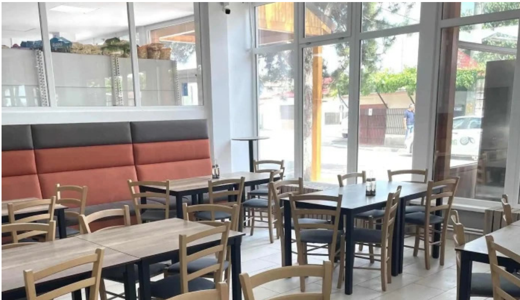
Agneza lacto bar site web