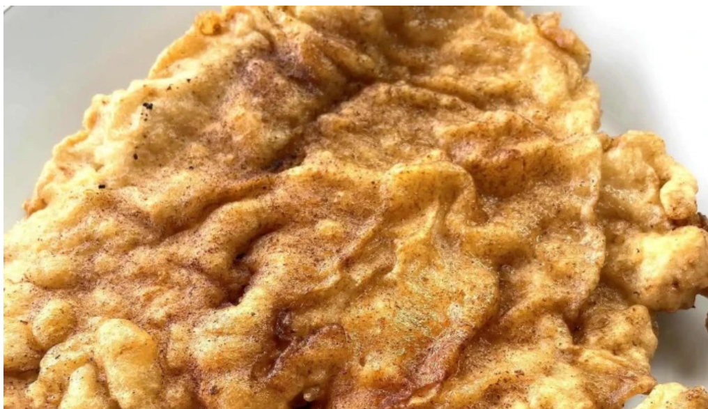
Agneza lacto bar comentarii