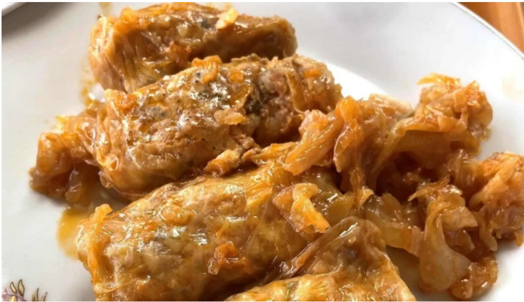
Agneza lacto bar fotografii