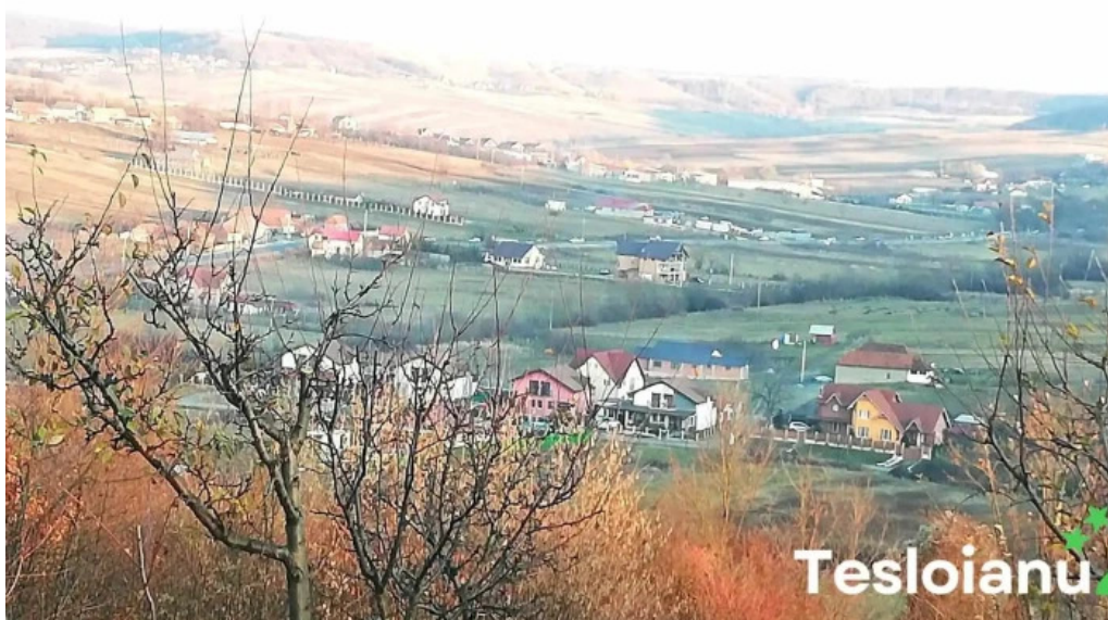
Hidiselu de jos munte