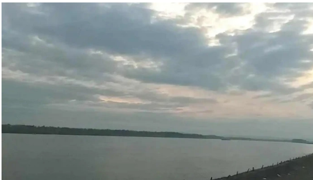
Comuna garla mare promo?ie