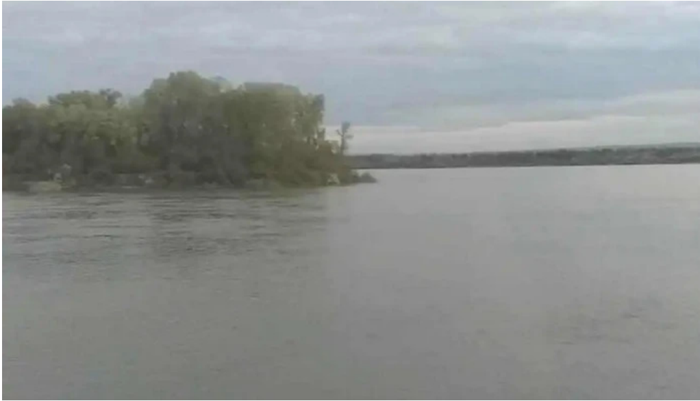
Comuna garla mare videoclipuri