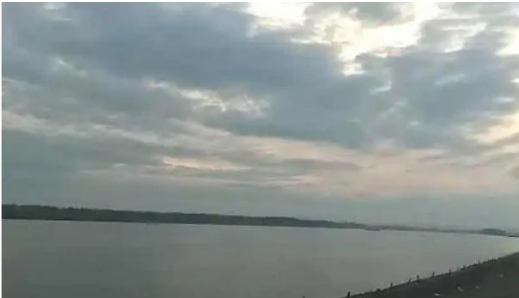
Comuna garla mare romania