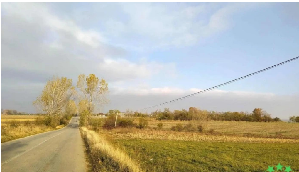
Comuna mozaceni promo?ie