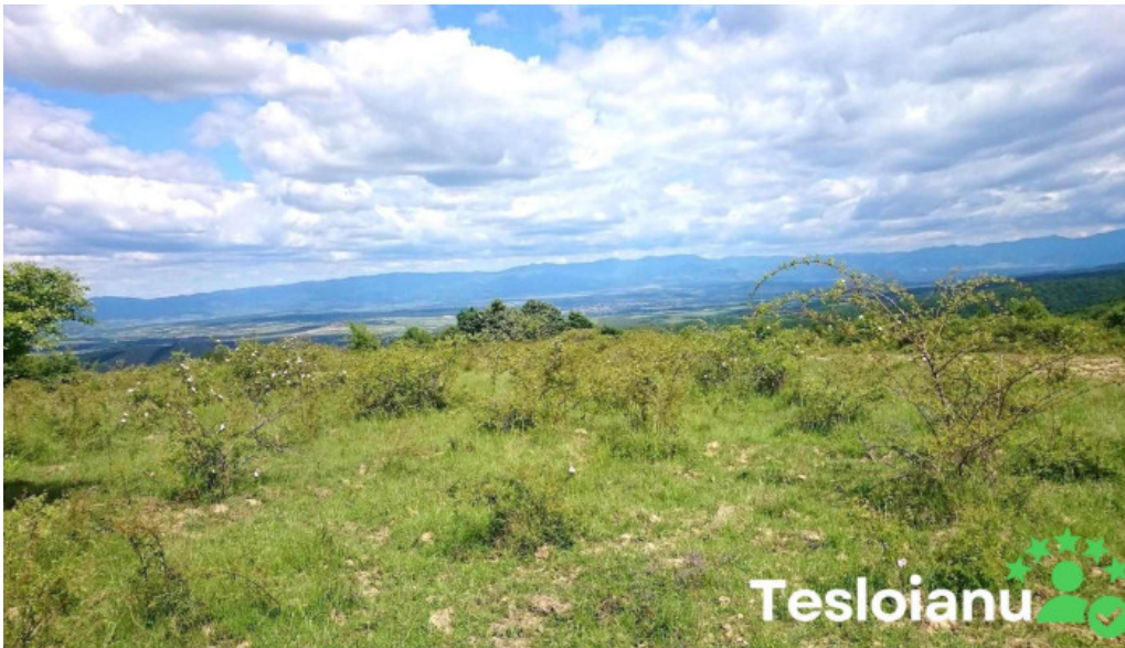
Comuna ?oimi romania