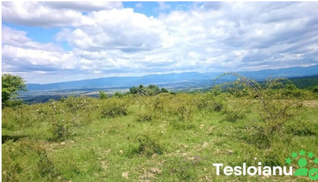
Comuna soimi fotografii