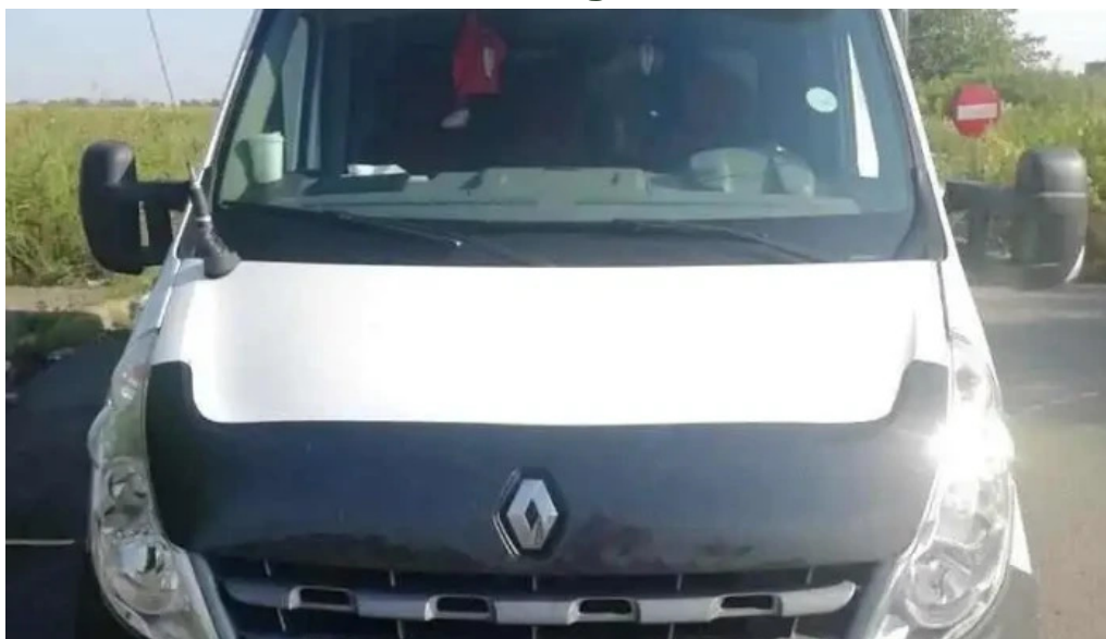
Comun? albe?ti paleologu romania