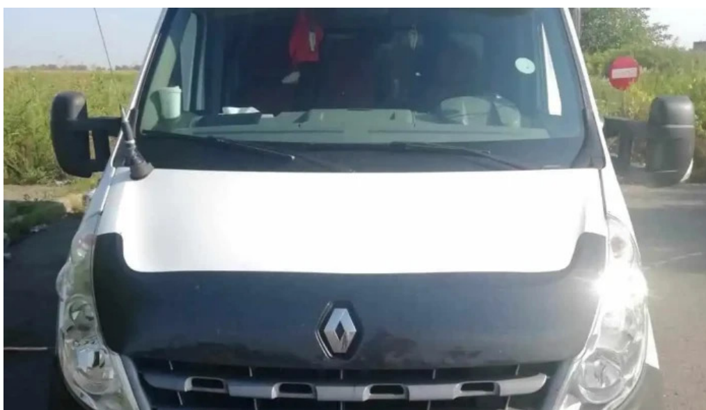
Comuna albesti paleologu cum s? ajungi acolo