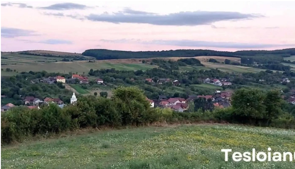
Somes uileac instagram