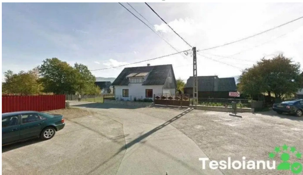
Prolact vicovu de sus