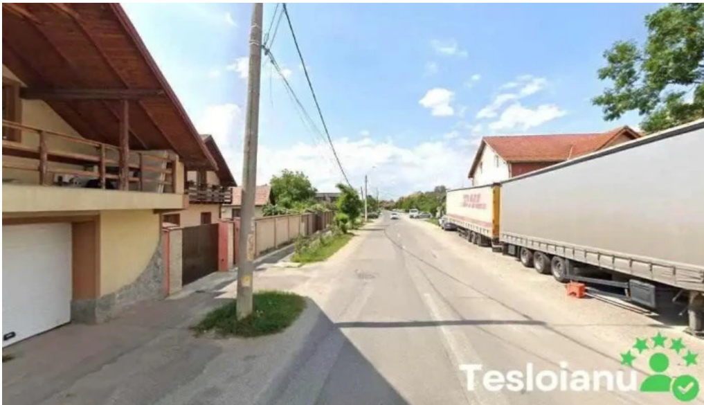
Usr sanpetru sanpetru