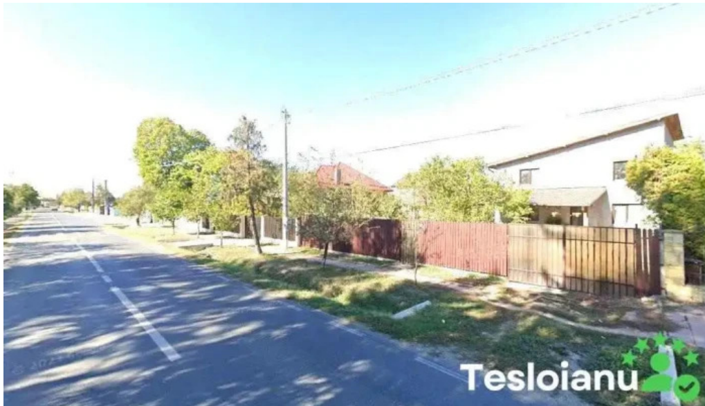
Postul de poli?ie peri? peri?