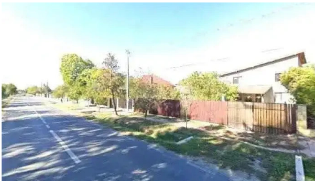
Postul de politie peris deschis acum