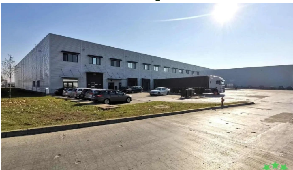
Bunzl romania srl zon?