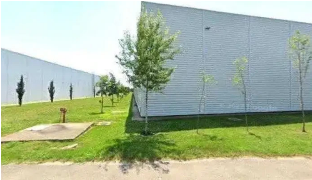
Bunzl romania srl street view si 360deg