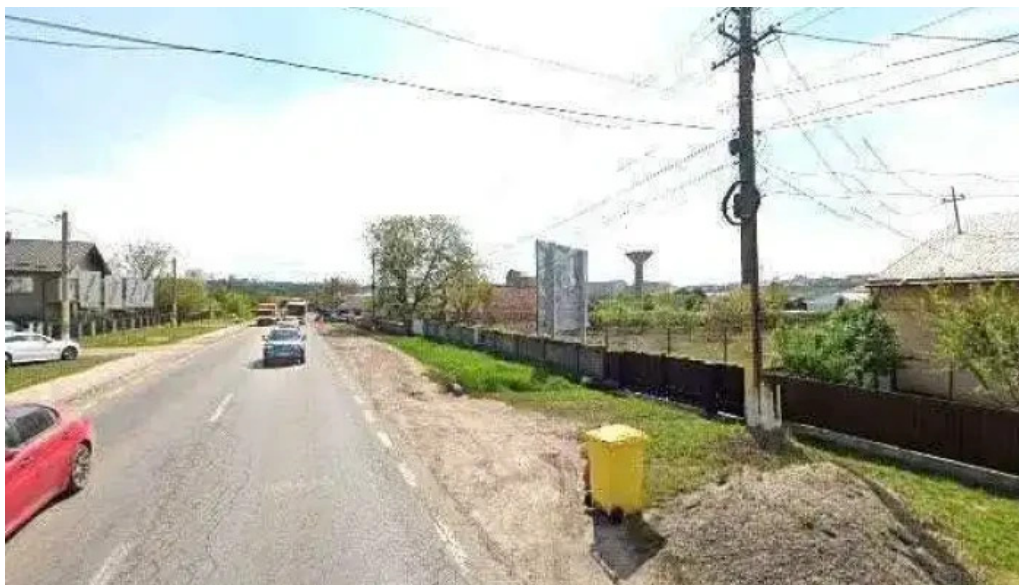
Glasul sucevei instagram