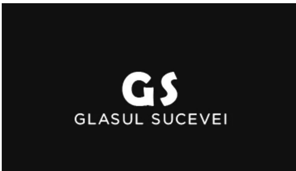
Glasul sucevei de la proprietar