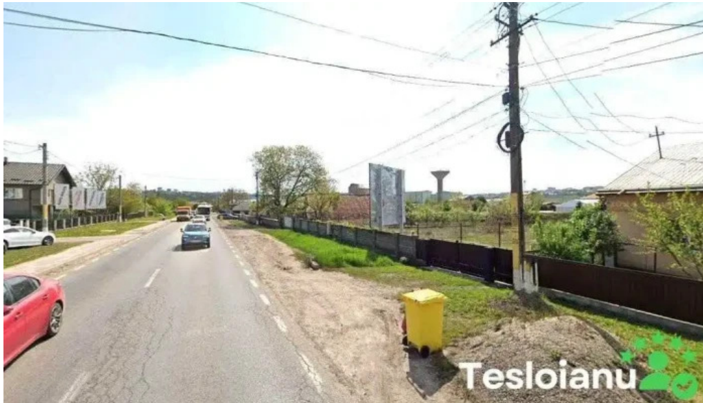
Glasul sucevei suceava