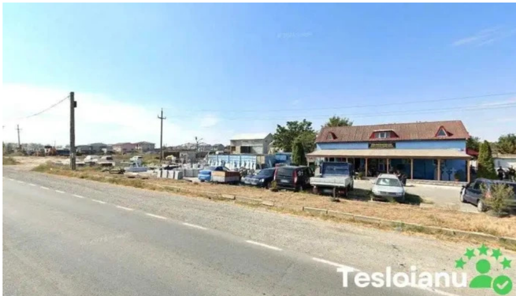
Monumente funerare ovidiu vasea trade ovidiu