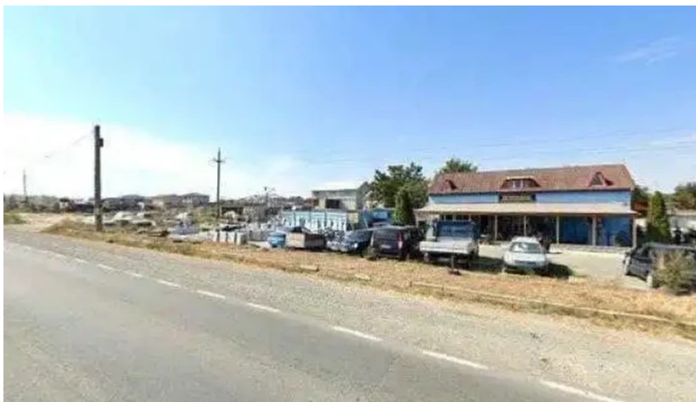
Monumente funerare ovidiu vasea trade reduceri