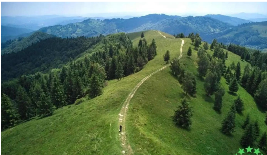
Vf sec?ria sec?ria