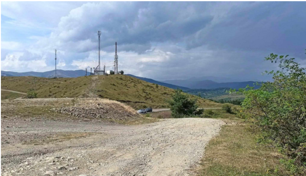
Vf secaria sec?ria