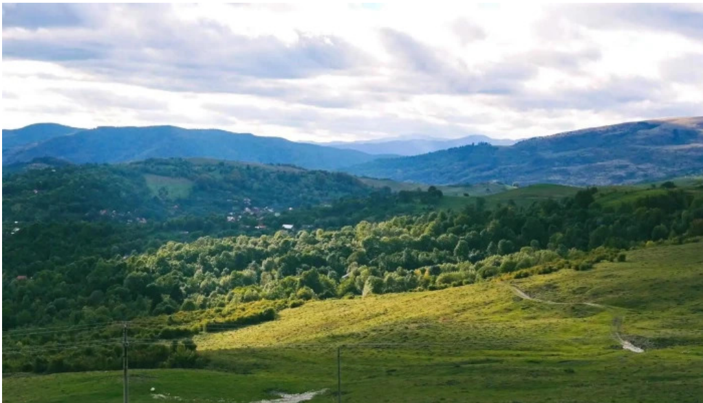
Vf secaria promo?ie