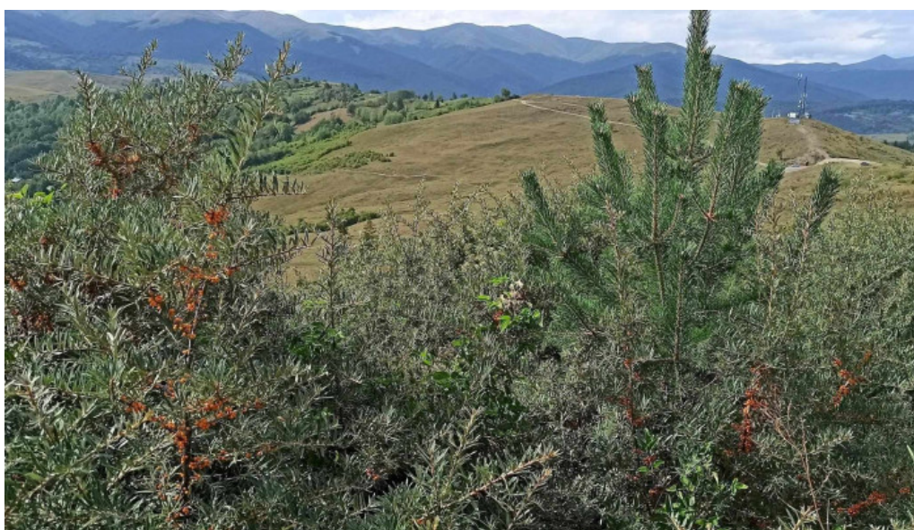
Vf secaria telefon