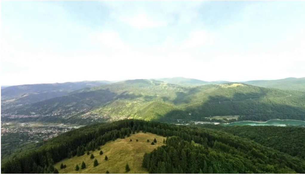
Vf secaria street view si 360deg