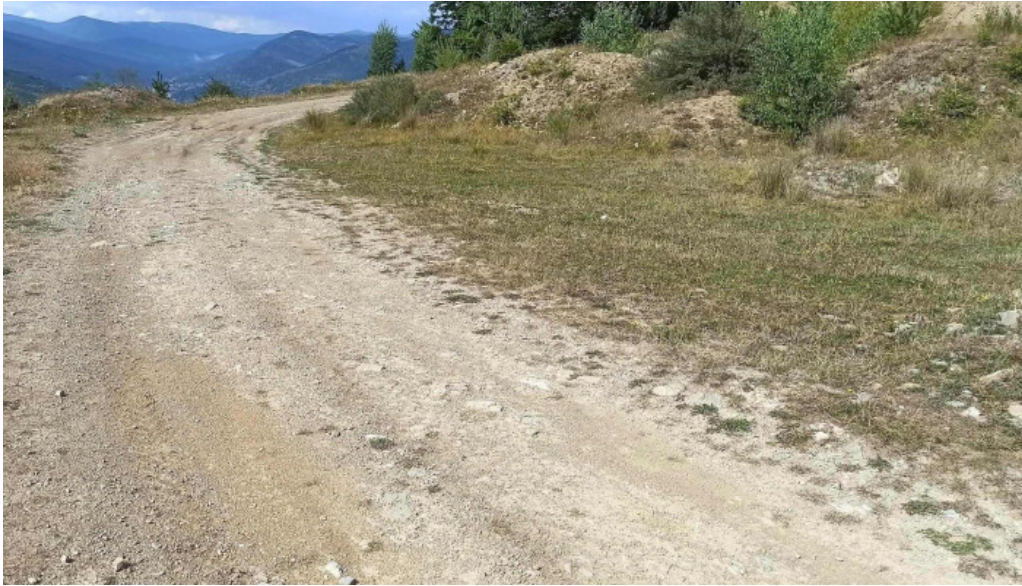
Vf secaria recenzii